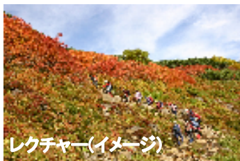
レクチャー(イメージ)