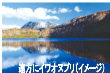
遠方にイワオヌプリ(イメージ)

▲歩行時間 約3時間+α+休憩時間 ※天候、現地事情、交通機関などの影響によりコース内容、解散時間などの変更もありますので予めご了承下さい。※沼は行きません。